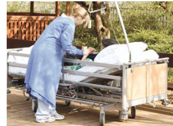
Patient mit einer Pflegekraft im Garten der Palliativstation

Hier setzt die „Mainzer Palliativstiftung – Leben bis zuletzt“ an.